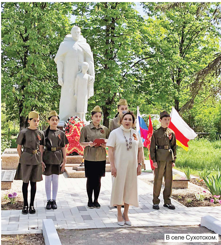
В селе Сухотском.

Для жителей России слово «память» – не пустой звук. История и время это доказали. Не пустым является для нас значимое выражение «дружба народов». Как можем мы мыслить и чувствовать, жить и строить будущее иначе, когда наши деды и прадеды разных национальностей и вероисповеданий, разных взглядов, возрастов и судеб сражались плечом к плечу за единую Родину-мать! Они пролили свою кровь за наше настоящее, за мир на земле, мир, свободный от любых проявлений нацизма.